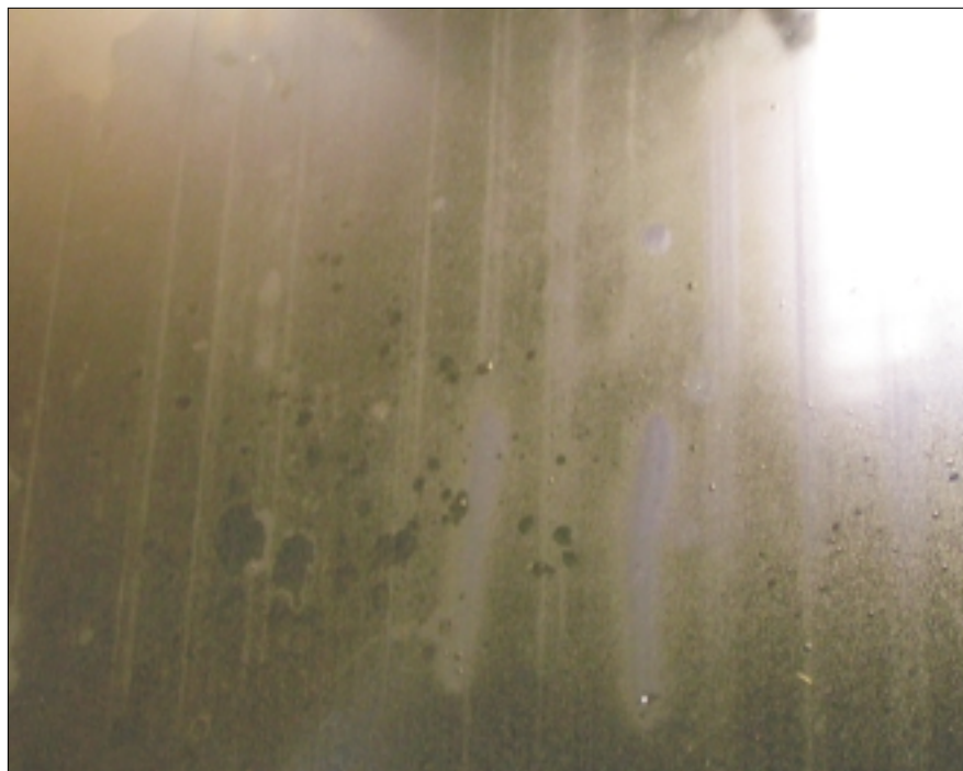
Rys. 4. Ślady na powierzchni szkła uwidocznione przez skondensowaną parę wodną